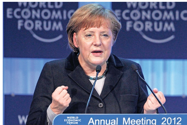
Deutschlands Bundeskanzlerin Angela Merkel bei ihrer Eröffnungsrede.

ge Lasten auf die öffentlichen Finanzen zu. Die Schweizer Finanzministerin rief in ihrer Rede deshalb zu sofortigem Handeln auf. Ausser Justizministerin Simonetta Sommaruga sind alle übrigen Bundesräte nach Davos gereist. Noch nie war die Schweizer Regierung in Davos so zahlreich vertreten. Das Wef dauert noch bis zum Sonntag. SDA/SMA