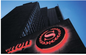
Hier logierte der Betrüger.