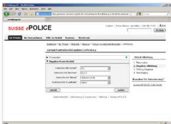
eMeldung erfassen: Die Kunden werden bei der Erfassung von Meldungen schrittweise geführt.

So kann man das sehen. Aber den Bürgerinnen und Bürgern ist mit unserer Präsenz auf der Strasse wahrlich mehr gedient als im Büro.