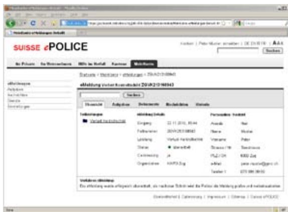
Benutzerkonto Kunde: Im Benutzerkonto kann der Kunde seine Meldung und Aufgaben verwalten, Dokumente speichern und Nachrichten schreiben.

Es geht hier um elementare und einfach zu handhabende Anzeigen wie den Fahrraddiebstahl, Diebstahl, Sachbeschädigungen, Ausweis- und Kontrollschildverlust. Im Wirtschaftssektor sehen wir das Hauptpotential vor allem im Bereich der Sachbeschädigungen.