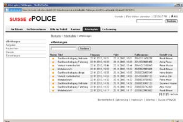
Arbeitsplatz ePolizist: Eingehenden Meldungen werden den verantwortlichen Polizisten im «Arbeitsplatz» zur weiteren Bearbeitung angezeigt.

Lassen Sie mich mit einem Vergleich beginnen: Die Technologie und Ihre Nutzung haben in den vergangenen Jahren Quantensprünge vollzogen. So wurde zum Beispiel das eBanking, welches anfänglich als unsicher kritisiert wurde, innert weniger Jahre salonfähig. Einen ähnlichen Prozess hat Suisse ePolice vor sich. Wir stehen inhaltlich und mit der Harmonisierung noch am Anfang, und werden deshalb mit einfach abzuwickelnden Geschäftsfällen beginnen. Hingegen können wir von modernen Technologien aus anderen Branchen wie dem Finanzsektor profitieren. Das volle Potential der